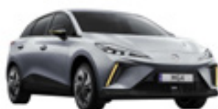
● Medal Silver