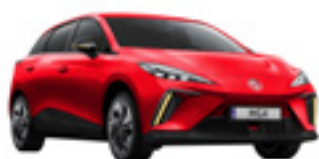
● Diamond Red