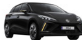
● Pebble Black