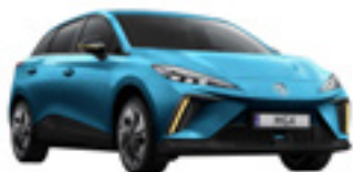
● Brighton Blue