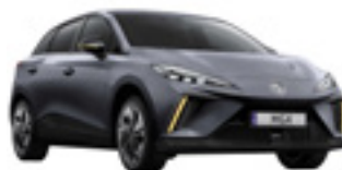
● Andes Grey