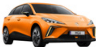
● Fizzy Orange