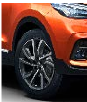
Jante 17" model Active (motorizare 1.0)