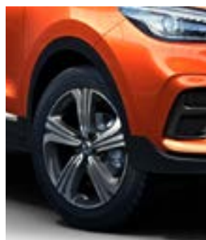
Jante 17" model Dinamic (motorizare 1.5)