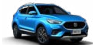
Cosmo Blue (metallic)