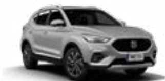
Monument Silver (metallic)