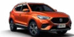
Hexton Orange (metallic)