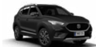
Pebble Black (metallic)