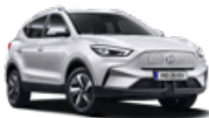
Dover White (non-metallic)