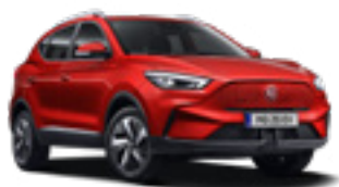
Diamond Red (metallic)