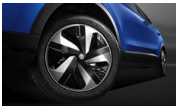
Jante din oțel de 17" + capac Aero