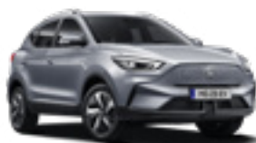
Monument Silver (metallic)