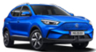
Cosmo Blue (metallic)