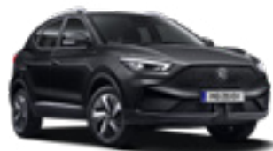
Pebble Black (metallic)